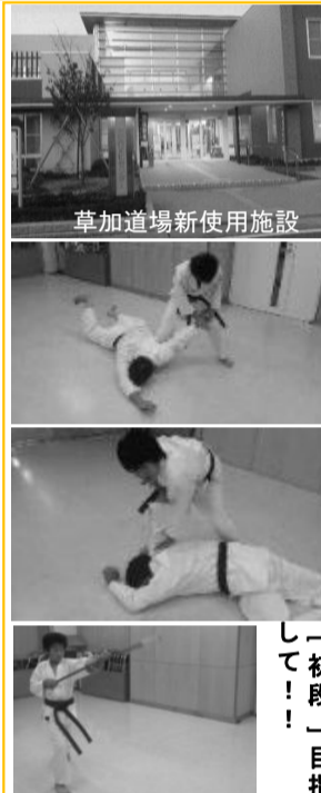
草加道場新使用施設

新年を迎える事が出来ました。今年も大震災等に負けない位の気持ちで一生懸命頑張って行こうと思っておりますので本年もよろしくお願いたします。