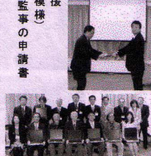
東芝従業員向け「イーパーツ」PC寄贈プログラム

四 改正NPO法人と東日本大震災の影響等に関する特定 非営利活動法人の実態調査(内閣府大臣官房市民活動促進課 3月20日提出)