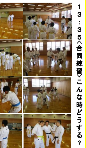
13:35 合同練習こんな時どうする？