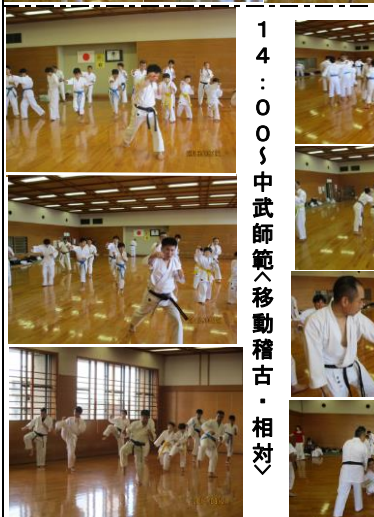
14:00 中武師範へ移動稽古・相対